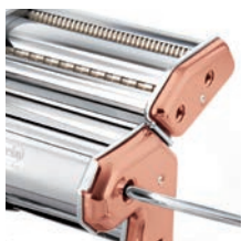
Art. imperia® iPasta Rame