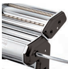
Art. imperia® iPasta Nera