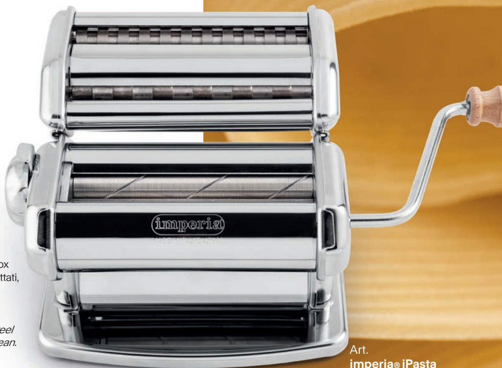
Art. imperia® iPasta Acciaio cromato

Patented ribbed 18/10 stainless steel rollers, easy to clean.