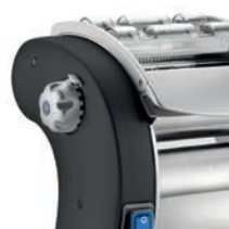
Art. imperia® PastaPresto Gourmet Grigio Antracite