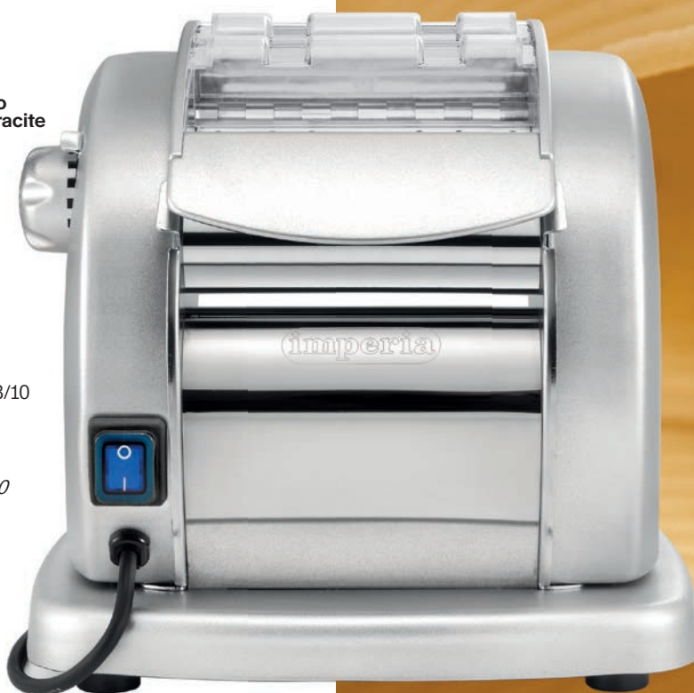
Art. imperia® PastaPresto Gourmet silver

Patented ribbed 18/10 stainless steel rollers, easy to clean.